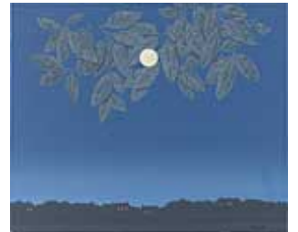
La Page blanche, 1967

6/ Montrez ce qui est caché, et inversement